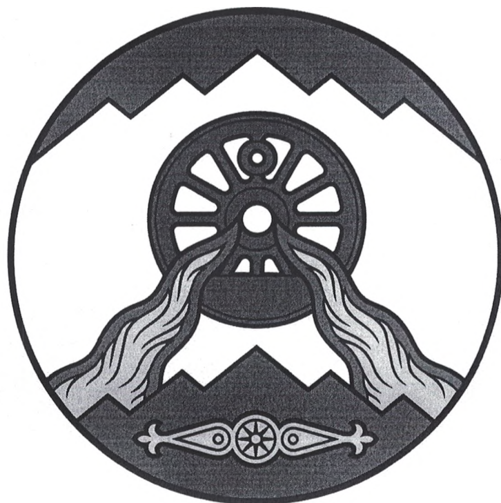
Герб Гудермесского муниципального района (примеры воспроизведения в цвете)