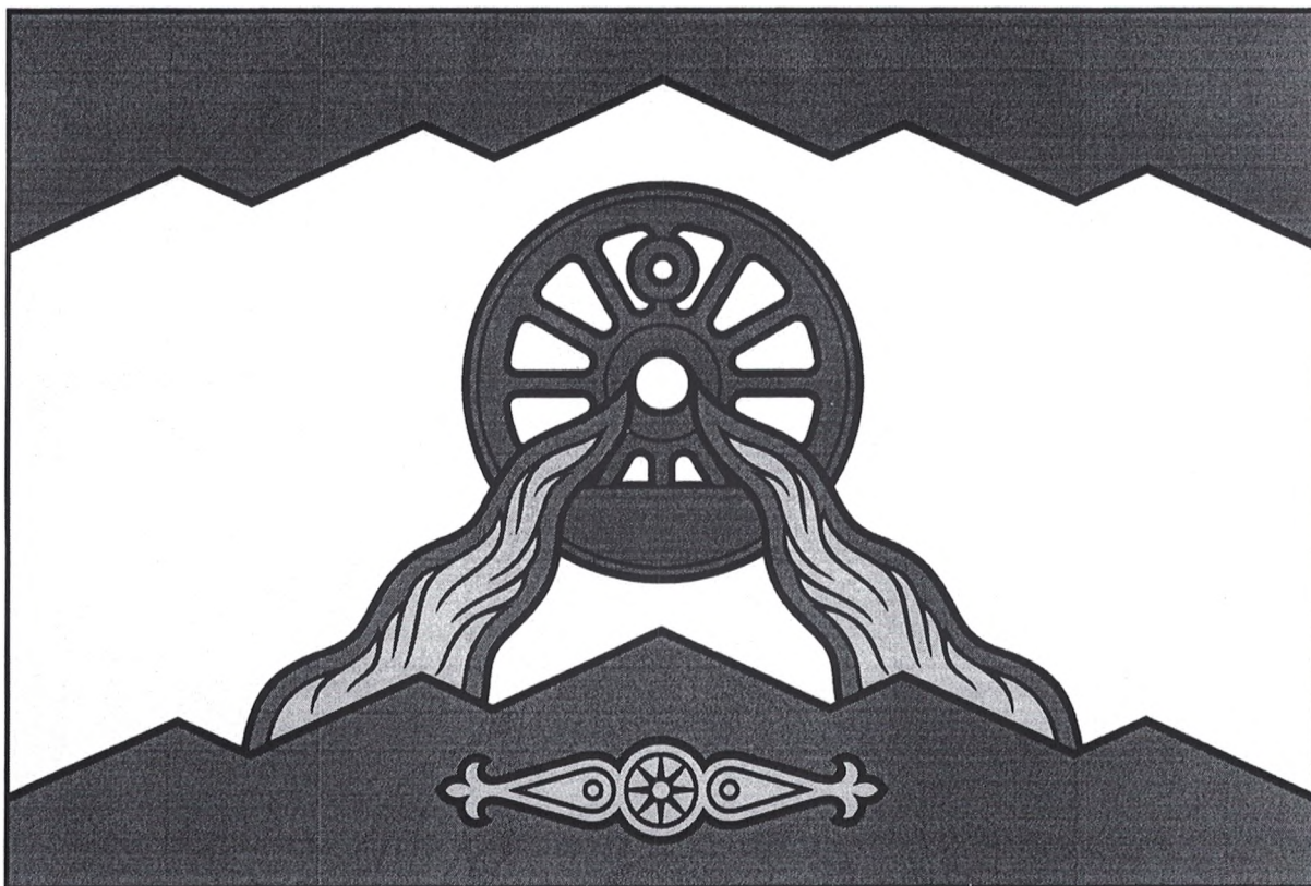
Флаг Гудермесского муниципального района (цветное изображение)